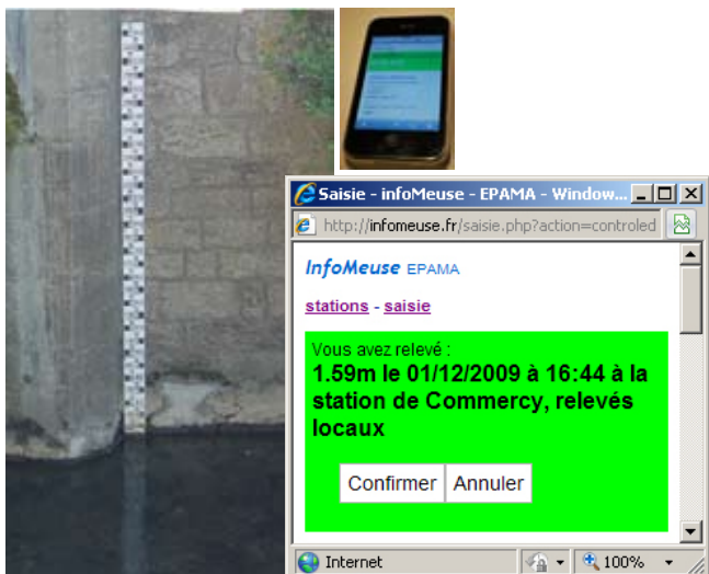
Saisie des hauteurs d'eau observées depuis tout ordinateur ou terminal mobile relié à internet.

> InfoMeuse réunit l'ensemble des données pour faciliter l'anticipation des crues.