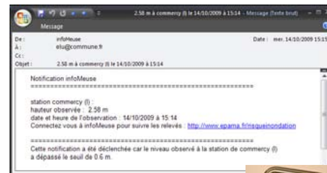
Notification par email. Notification par sms.

Dès que le seuil est atteint, InfoMeuse transmet un message à l'utilisateur.